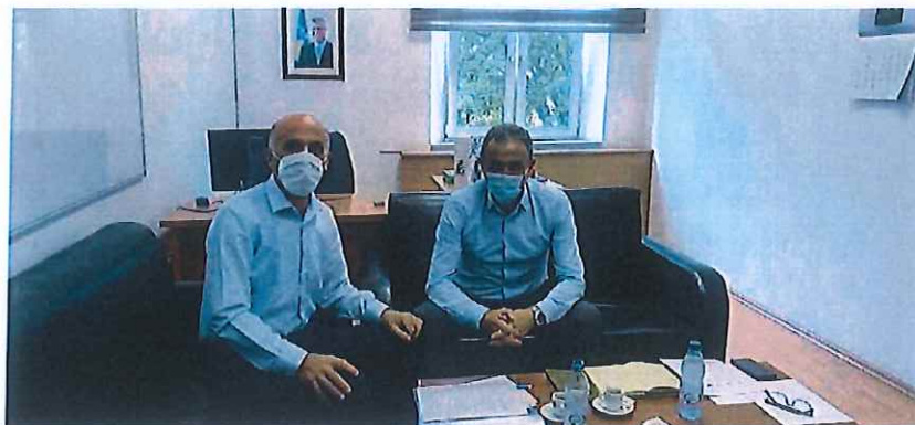
Takimi i kryetarit të OSK-së me Zv. Ministrin e Shëndetësisë