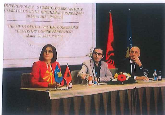
Pamje nga Konferenca e V-të Stomatologjike -Virtuale, 20 mars 2021

Oda e Stomatologëve të Kosovës me rastin e shënimit të ditës botërore të Shëndetit Oral ka organizuar Konferencën e V-të Stomatologjike-Virtuale me datë 20 Mars 2021 në Prishtinë. Konferenca ka përfshirë 8 ligjerata me ligjërues vendorë dhe ndërkombëtarë nga SHBA, Kroacia, Shqipëria dhe Maqedonia Veriore. Pjesëmarrja ka qenë mjaft masive.