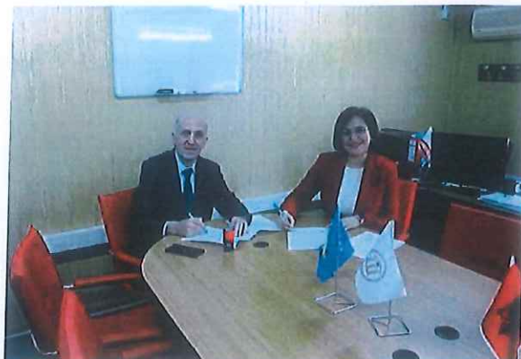
Memorandumi me Shoqatën e Stomatologëve të Kosovës

shkencore, seminare, simpoziume, trajnime dhe forma tjera, me qëllim të mbështetjes së procesit të ngritjes dhe avancimit profesional të stomatologëve në nivel vendi..