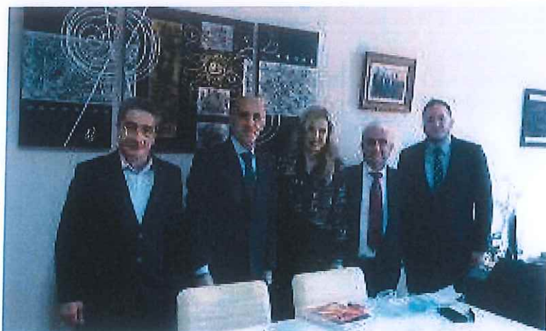
Nga takimi në Fakultetin e Mjekësisë Dentare-Tiranë

Në këtë takim u nënshkrua edhe Marrëveshja e bashkëpunimit, ku shprehëm vullnetin tonë për bashkëpunim të qëndrueshëm me interes bilateral.