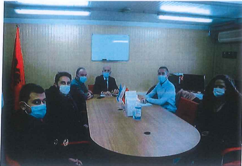
Nga takimi me specializantët e stomatologjisë

Kjo kërkesë ka hasur në mirëkuptim dhe se janë bërë përgatitjet përfundimtare nga MSH për realizimin e financimit të specializantëve.