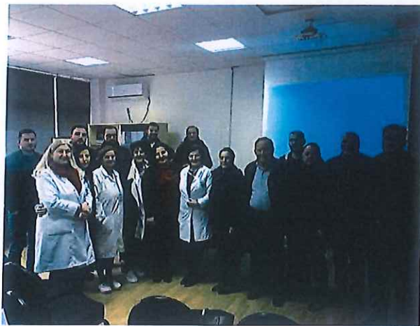
Pjesëmarrës në ligjeratën e organizuar në QKMF-Mitrovicë

Nga programit i ligjeratave për vitin 2020 nëpër Qendrat Kryesore të Mjekësisë Familjare është mbajtur vetëm një ligjeratë, sepse pas shpërthimit të pandemisë Covid-19, Qeveria jonë kishte ndërmarr masat anticovid 19 në nivel vendi, të cilat janë të njohura për të gjithë ne.