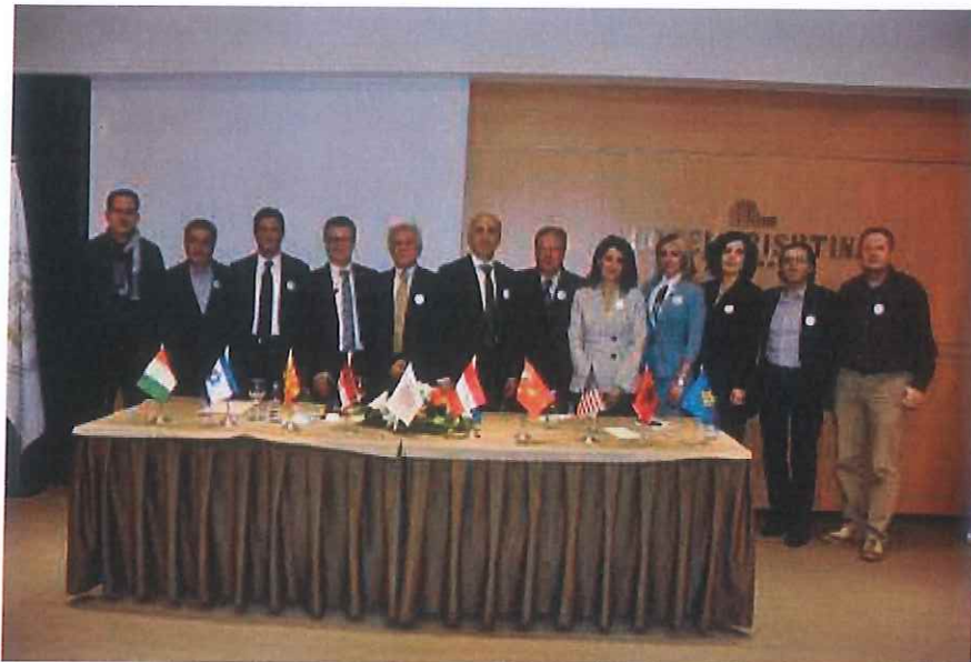
Pamje nga Konferenca e VI-të Stomatologjike -Virtuale, 18 dhjetor 2021

ndërkombëtarë nga Austria, Turqia, Izraeli, Kroacia, Shqipëria dhe Maqedonia Veriore. Mbi 900 stomatolog kanë marrë pjesë në konferencë.