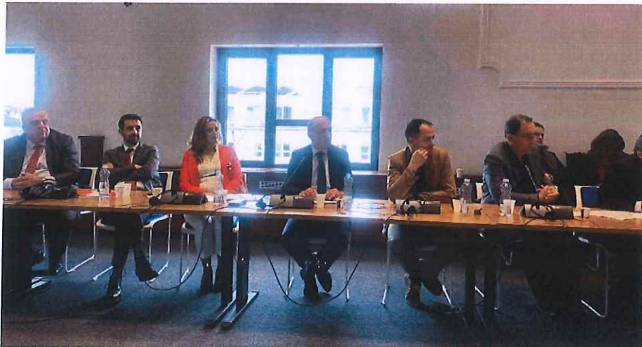
Pamje nga tryeza “Shëndeti Oral, të arriturat dhe sfidat”

Kryetari në këtë takim ngriti edhe shqetësimin e një pjese të komunitetit tonë të sektorit privat, i cili po ballafaqohet me probleme serioze në fazën e rilicencimit të ordinancave private stomatologjike. Për këtë Ministri Vitia u zotua se do të merret me zgjidhjen e këtij problemi.