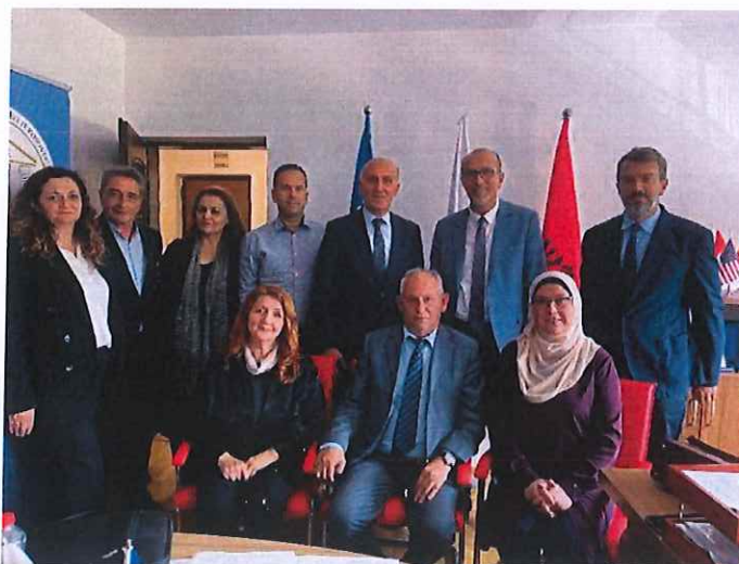
Pamje nga takimi me komisionin parlamentar për shëndetësi dhe mirëqenie sociale