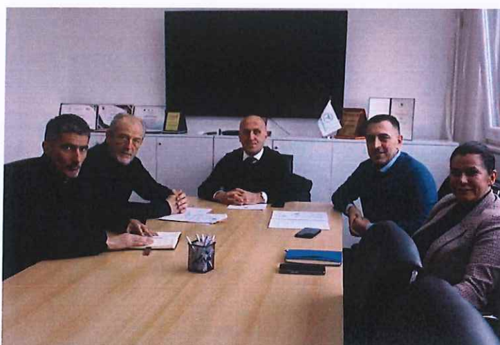
Pamje nga takimi me kryetarët e OPSH-ve

Në këtë takim u diskutua për zbatimin e legjislacionit të Odave të Profesionistëve Shëndetësor në Republikën e Kosovës.