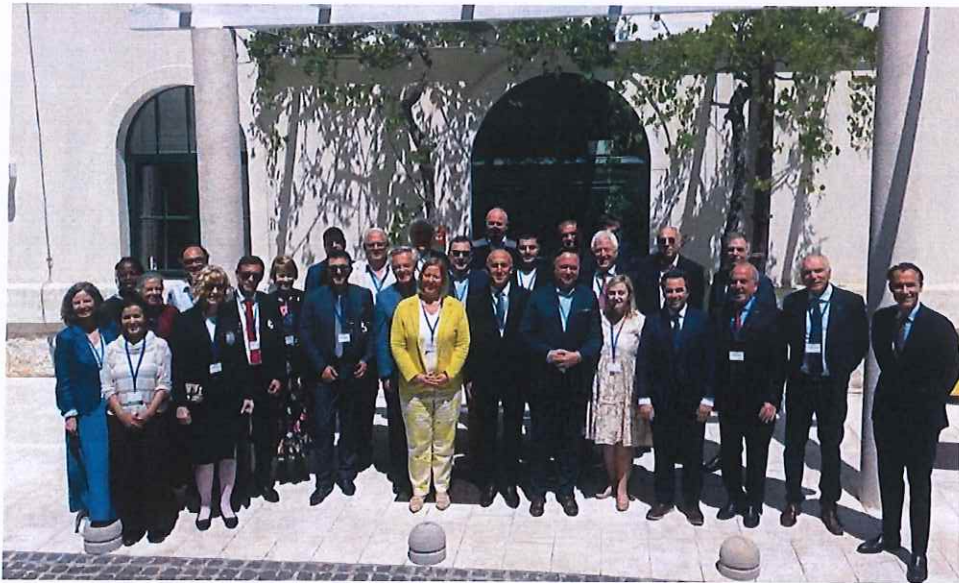
Pamje nga pjesëmarrja në Asambleenë e Përgjithshme të FEDCAR

Statusi i anëtarit vëzhgues në një entitet kaq prestigjioz si FEDCAR, rrit besueshmërinë ndaj stomatologjisë në vendin tonë, dhe do të jetë një mundësi për të përparuar, për të mësuar dhe për të ndarë njohuri me komunitetin stomatologjik evropian.