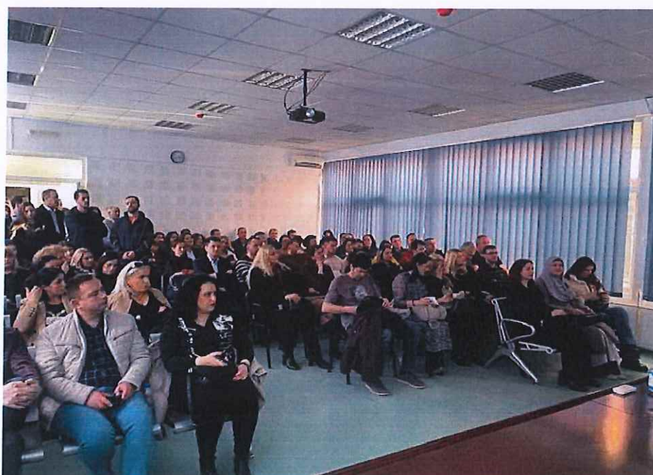
Pamje nga një ligjëratë profesionale e mbajtur në Prishtinë

Janë organizuar cikle të ligjëratave profesionale me tema të ndryshme nga praktika stomatologjike. Këto ligjërata janë mbajtur nga ekspertët vendor dhe janë ndjekur nga një numër i madh i stomatologëve.