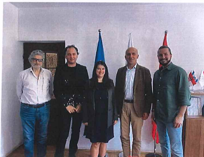
Pamje nga takimi me ekspert ligjor të projektit

BE. Për më tepër, direktivat e BE-së për njohjen e kualifikimeve profesionale janë bazë e procesit të Berlinit, i cili do të mundësojë lëvizjen e lirë të profesionistëve në vendet e Ballkanit Perëndimor.