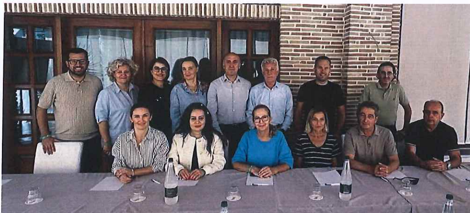
Pamje nga punëtorja për hartimin e Kodit Etik dhe deontologjisë stomatologjike

OSK ka organizuar punëtorinë tre ditore për hartimin e Kodit Etik të ri që ka rëndësi të madhe sepse siguron udhëzime profesionale për doktorin e stomatologjisë për të vepruar me integritet, duke ndihmuar në shmangien e konflikteve etike dhe siguron standarde të larta të kujdesit stomatologjik.