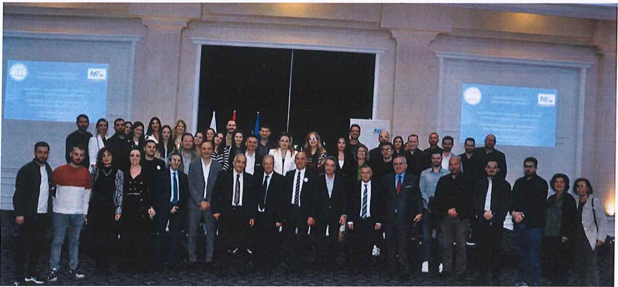
Pamje nga Simpoziumi Profesional i organizuar nga OSK

Ky simpozium i organizuar nga OSK ishte një platformë e rëndësishme për të marrë njohuri, përvoja dhe praktika të mira në fushën e emergjencave mjekësore brenda praktikës stomatologjike.