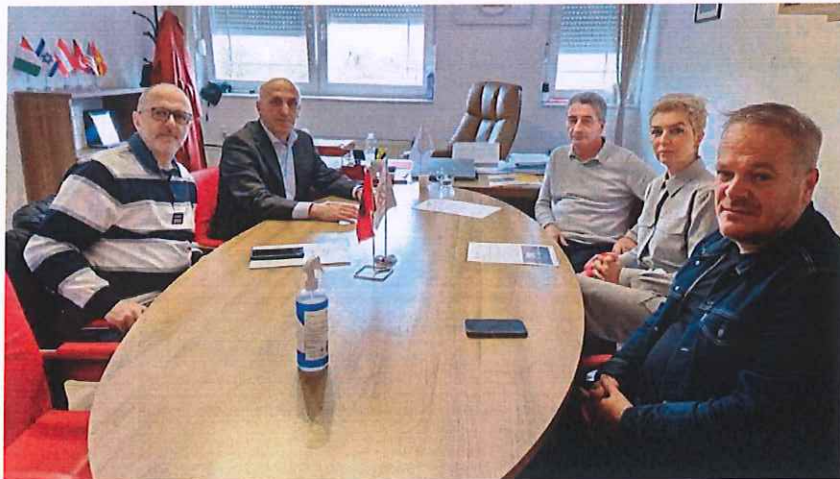
Pamje nga takimi me përfaqësues të stomatologëve të sektorit privat