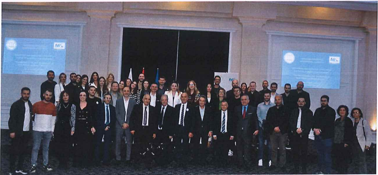
Pamje nga Simpoziumi Profesional i organizuar nga OSK

Ky simpozium i organizuar nga OSK ishte një platformë e rëndësishme për të marrë njohuri, përvoja dhe praktika të mira në fushën e emergjencave mjekësore brenda praktikës stomatologjike.