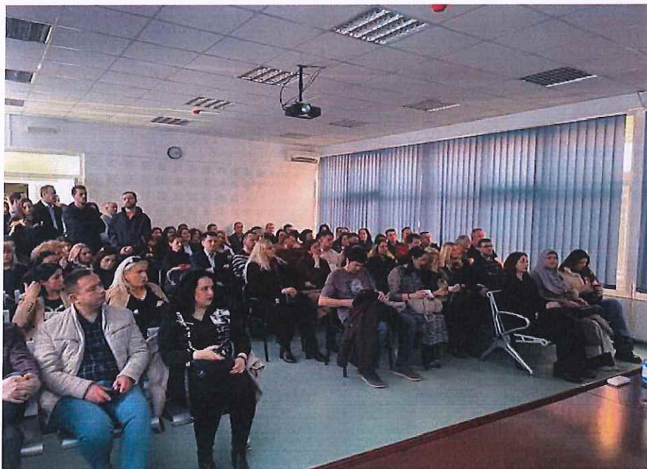
Pamje nga një ligjëratë profesionale e mbajtur në Prishtinë

Janë organizuar cikle të ligjëratave profesionale me tema të ndryshme nga praktika stomatologjike. Këto ligjërata janë mbajtur nga ekspertët vendor dhe janë ndjekur nga një numër i madh i stomatologëve.