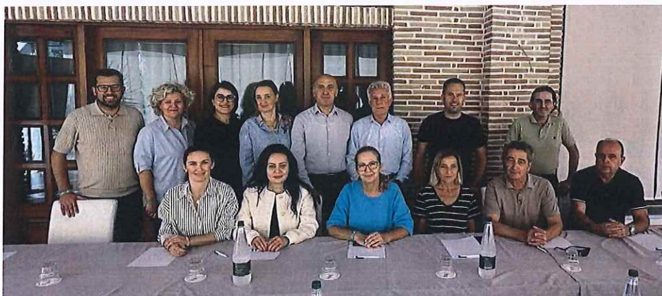
Pamje nga punëtorja për hartimin e Kodit Etik dhe deontologjisë stomatologjike

OSK ka organizuar punëtorinë tre ditore për hartimin e Kodit Etik të ri që ka rëndësi të madhe sepse siguron udhëzime profesionale për doktorin e stomatologjisë për të vepruar me integritet, duke ndihmuar në shmangien e konflikteve etike dhe siguron standarde të larta të kujdesit stomatologjik.