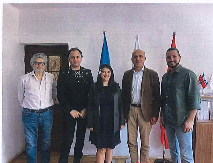
Pamje nga takimi me ekspert ligjor të projektit

Qëllimi i këtij projektit është harmonizimi i njohjes së ndërsjellë të kualifikimeve profesionale me Acquis të BE-së. Acquis është organ i të drejtave dhe detyrimeve të përbashkëta që është i detyrueshëm për të gjitha shtetet anëtare të BE-së. Përafrimi i legjislacionit kombëtar në Kosovë duke përfshirë strukturën institucionale me Acquis të BE-së për njohjen e kualifikimeve profesionale, do t'u mundësojë qytetarëve të Kosovës të ushtrorjnë profesionin e tyre në një shtet tjetër anëtar të BE-së, e me këtë edhe profesionin e stomatologut, pas anëtarësimit të Kosovës në BE. Për më tepër, direktivat e BE-së për njohjen e kualifikimeve profesionale janë bazë e procesit të Berlinit, i cili do të mundësojë lëvizjen e lirë të profesionistëve në vendet e Ballkanit Perëndimor.