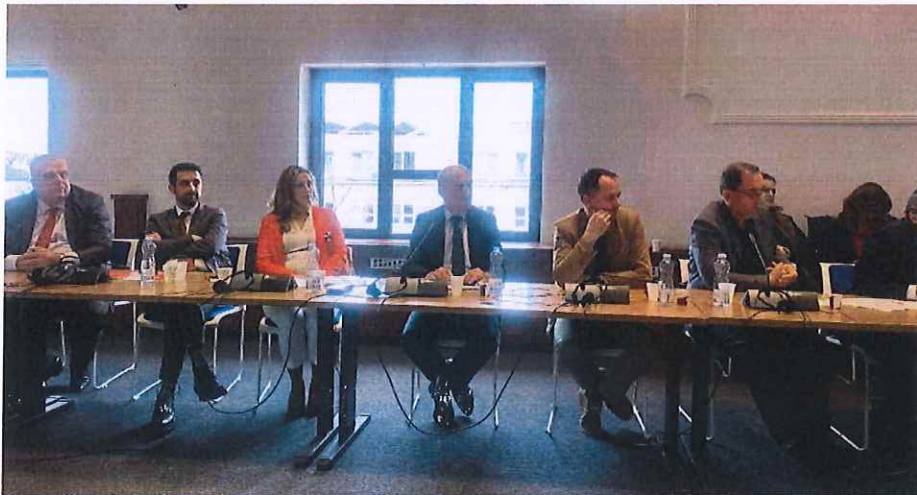
Pamje nga tryeza “Shëndeti Oral, të arriturat dhe sfidat”