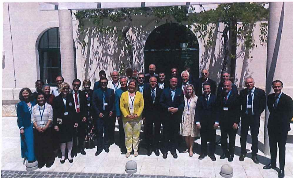
Pamje nga pjesëmarrja në Asamblenë e Përgjithshme të FEDCAR