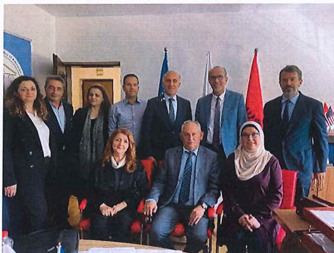
Pamje nga takimi me komisionin parlamentar për shëndetësi dhe mirëqenie sociale

U diskutua edhe për shqetësimin e komunitetit tonë lidhur me UA nr. 02/2023 i cili ka të bëjë me kushtet dhe procedurat për ushtrimin e veprimtarisë shëndetësore në institucionet private, me të cilat ata janë duke u ballafaquar në fazën e rilicencimit të ordinancave private stomatologjike.