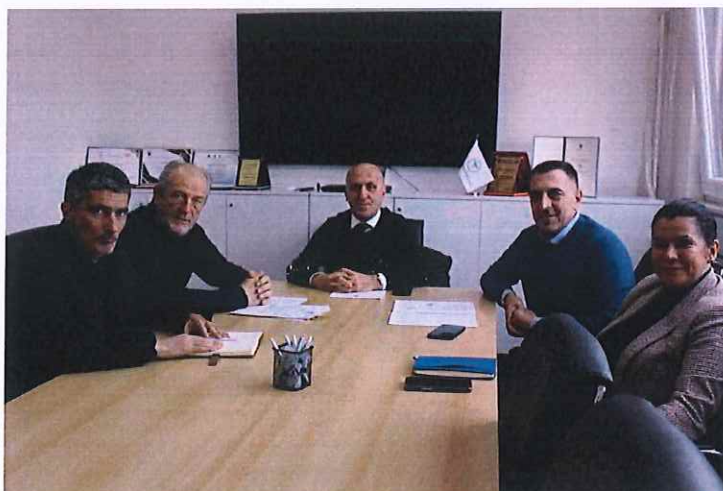
Pamje nga takimi me kryetarët e OPSH-ve

Në këtë takim u diskutua për zbatimin e legjislacionit të Odave të Profesionistëve Shëndetësor në Republikën e Kosovës.